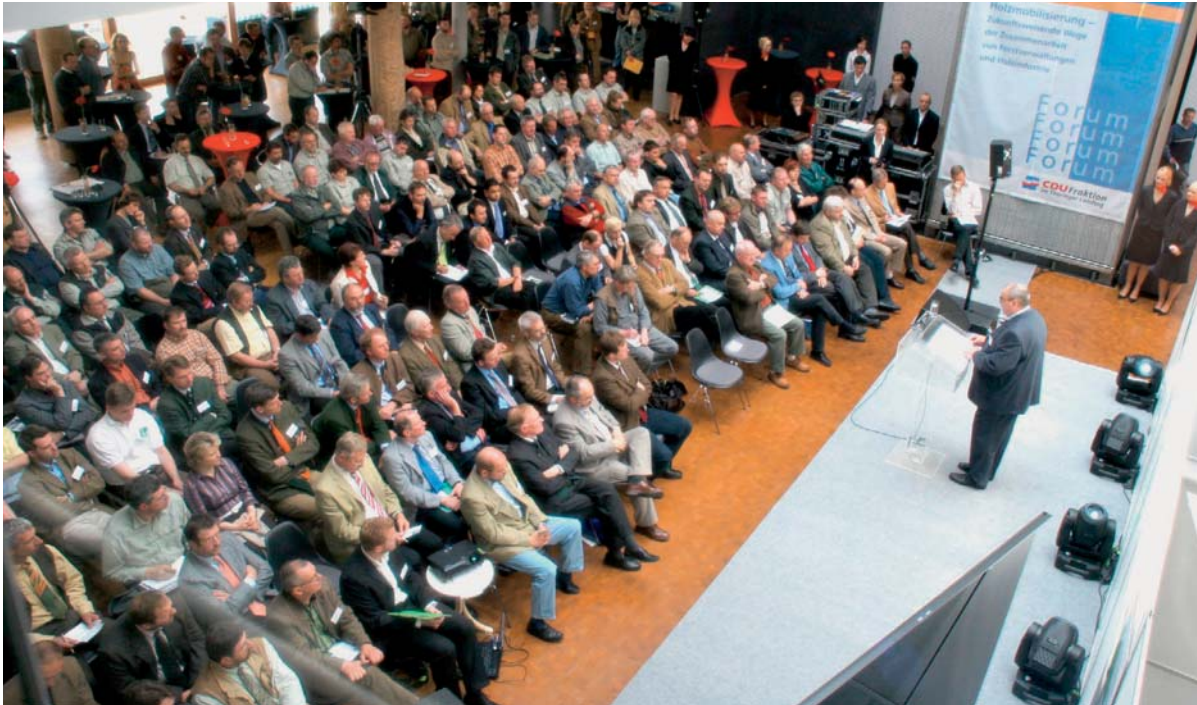
Blick ins Atrium (Verwaltungsgebäude Pollmeier Massivholz in Kreuzberg/Thüringen): Weit mehr Besucher als erwartet nehmen am Forum teil.